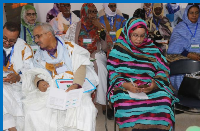
Akjoujt & Zouerate

Après Zouerate, retour à Nouakchott, le 14 janvier pour couvrir les 850 km qui sépare Zouerate de Nouakchott avec un arrêt bivouac aux environs de la ville d'Akjoujt.